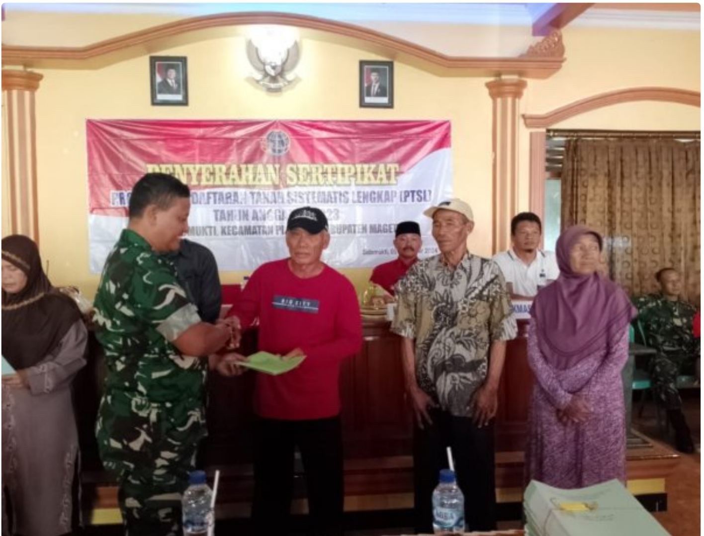
Danramil 0804/02 Plaosan Hadiri Penyerahan Sertifikat Program Pendaftaran Tanah Sistematis Lengkap (PTSL) Desa Sidomukti

PLAOSAN. - Desa Sidomukti melalui Badan Pertanahan Nasional (BPN) melakukan penyerahan Sertifikat Tanah Program Pendaftaran Tanah Sistematis