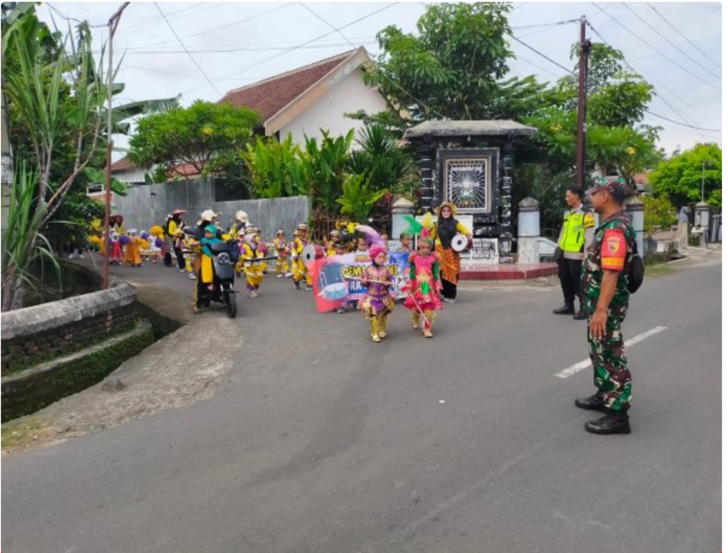
Gebyar Rojabiyah RA dan MI, Babinsa bersama Bhabinkamtibmas Amankan Jalannya Kegiatan Parade Drum Band