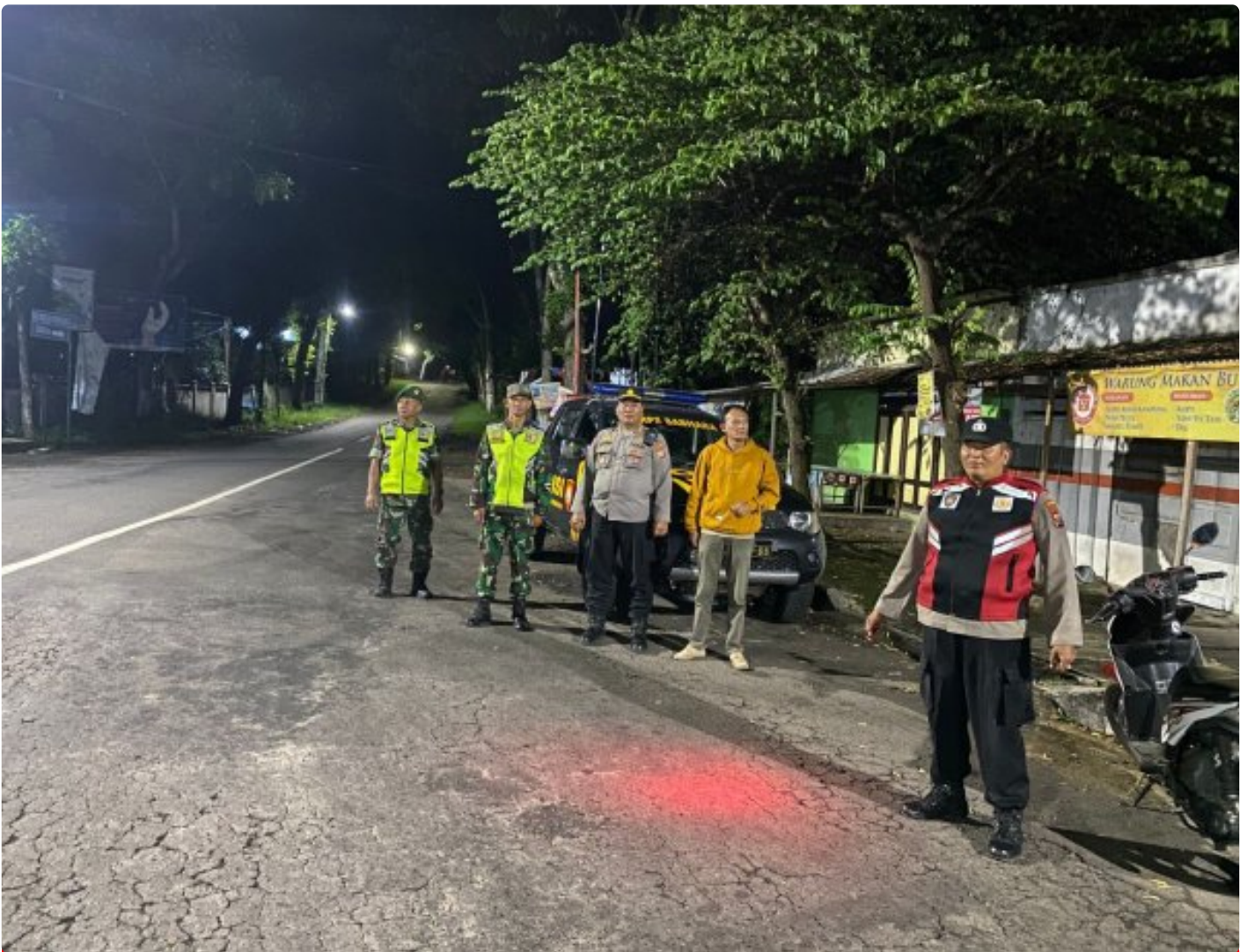
Jelang Tahun Baru 2025, Forkopimca Ngariboyo Gencar Laksanakan Patroli Malam

Magetan. - Personil gabungan dari Posramil Ngariboyo Koramil Tipe B 0804/01 Magetan, Polsek Ngariboyo dan aparat pemerintah Kecamatan Ngariboyo melaksanakan patroli malam hari dalam rangka meningkatkan keamanan yang kondusif pasca Hari Raya Natal dan menjelang Tahun baru yang akan datang.